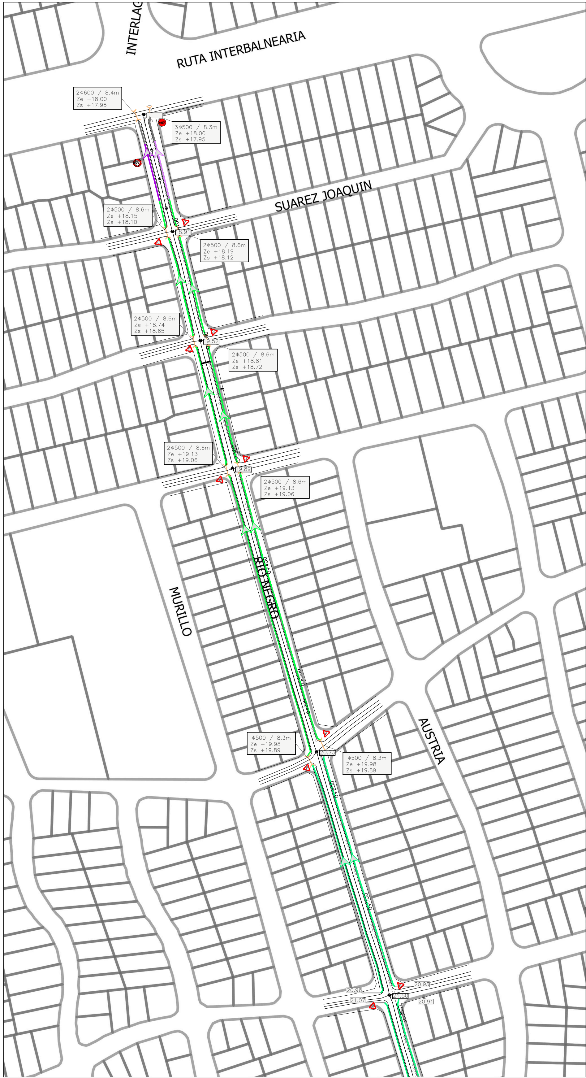
AVENIDA RÍO NEGRO (Progresiva 0K000.00 a 0K850.00) ESCALA: 1:2000